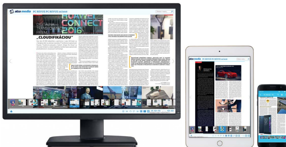
Digitálna verzia PC REVUE pre desktopy, tablety a smartfóny s Windows/iOS/Android

Magazín PC REVUE je dostupný aj v digitálnej podobe (tabletová aplikácia, PDF, HTML) pre rôzne typy zariadení: tablety, smartfóny či desktopy. Podporované sú všetky platformy operačných systémov Windows, iOS a Android.