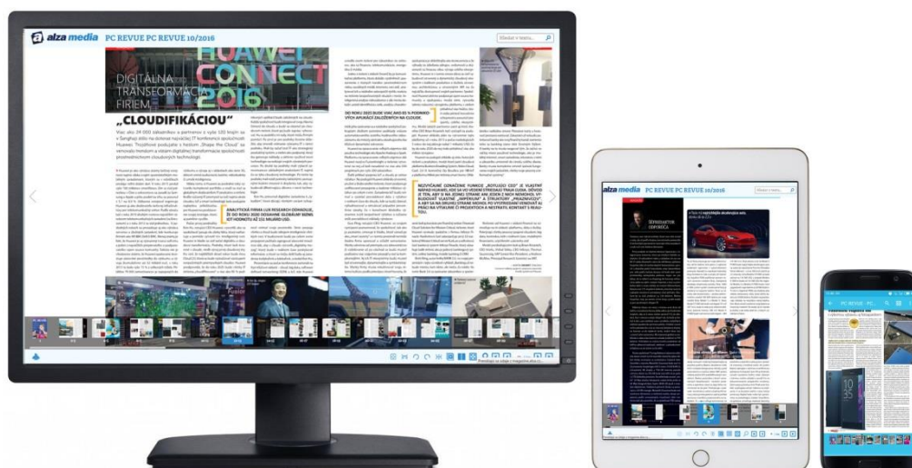
Digitálna verzia PC REVUE pre desktopy, tablety a smartfóny s Windows/iOS/Android

Magazín PC REVUE je dostupný aj v digitálnej podobe (aplikácia, PDF, HTML) pre rôzne typy zariadení: tablety, smartfóny či desktopy. Podporované sú všetky platformy operačných systémov Windows, iOS a Android.